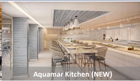
Aquamar Kitchen (NEW)