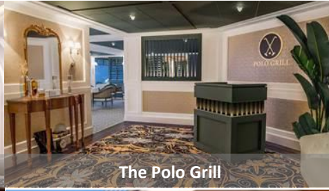
The Polo Grill