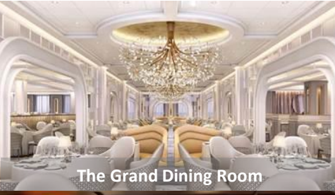
The Grand Dining Room