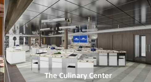
The Culinary Center