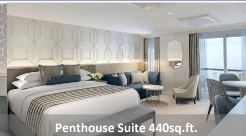
Penthouse Suite 440sq.ft.